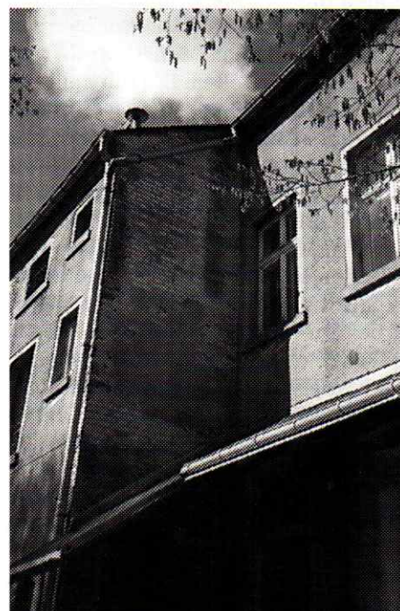
Katastrophaler Zustand der Grundschule Bad Elster: Notabstützungen innen (links) und Putzschäden außen (rechts).